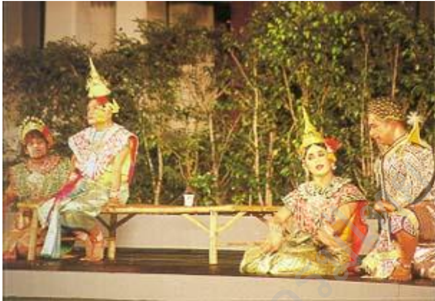
นิทานพื้นบ้านไทย จากหนังสือสารานุกรมไทยสำหรับเยาวชนฯ เล่ม ๒๖