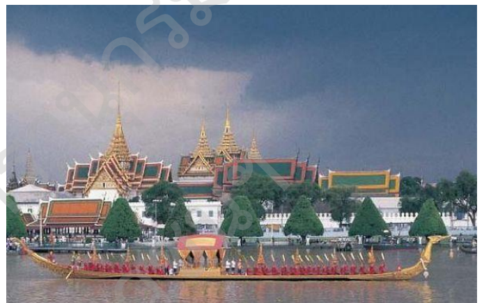
ศิลปะการเห่เรือ

จากหนังสือสารานุกรมไทยสำหรับเยาวชนฯ เล่ม ๑๕