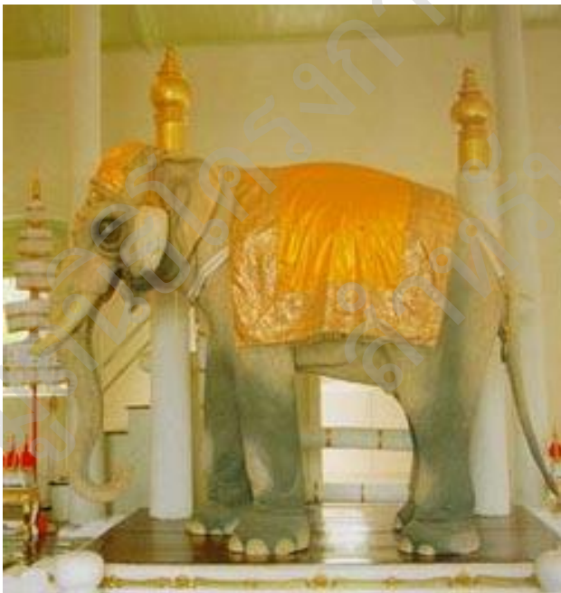
ช้างเผือก จากหนังสือสารานุกรมไทยสำหรับเยาวชนฯ เล่ม ๑๗

การสอนภาษาไทยเรื่องการเขียนรายงานจากการศึกษาค้นคว้า ครูสามารถนำภาพจากเรื่องต่าง ๆ ในหนังสือสารานุกรมไทยสำหรับเยาวชนฯ ไปให้นักเรียนดูเพื่อกระตุ้นความสนใจ เช่น