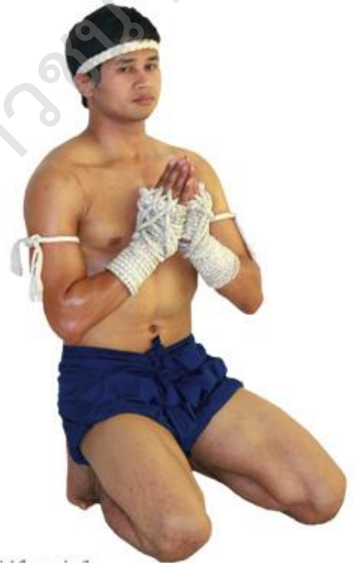
พักรังเด็กพระแม่ธรณี

จากหนังสือสารานุกรมไทยสำหรับเยาวชนฯ เล่ม ๒๗