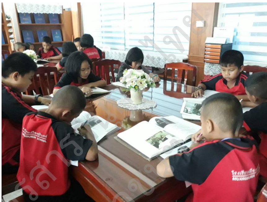
นักเรียนศึกษาค้นคว้าเนื้อหาจากหนังสือสารานุกรมไทยสำหรับเยาวชนฯ