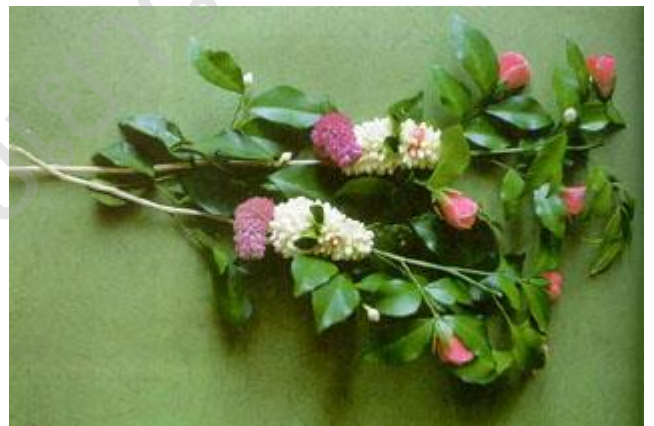
ไม้ดอกหอมของไทย จากหนังสือสารานุกรมไทยสำหรับเยาวชนฯ เล่ม ๒๒