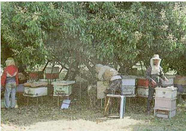
การเลี้ยงผึ้ง

๒.๒ การใช้เป็นสื่อประกอบบทเรียน การนำหนังสือสารานุกรมไทยสำหรับเยาวชนฯ ไปใช้เป็นส่วนประกอบบทเรียนนั้น ไม่นิยมนำไปใช้โดยตรง เนื่องจากเป็นหนังสือที่มีวัตถุประสงค์ในการจัดทำให้ใช้ได้คงทน จึงมีขนาดรูปเล่มค่อนข้างใหญ่และมีน้ำหนัก ประกอบกับเนื้อหาในแต่ละเล่มมีหลายสาขา แต่ละสาขาเหมาะกับผู้อ่านหลายระดับ ดังนั้น การนำไปใช้เป็นส่วนประกอบบทเรียน จึงควรผ่านการสร้างสรรค์ให้เหมาะสมกับเรื่องและวัยนักเรียน ครูอาจถ่ายเนื้อหาและภาพประกอบเฉพาะเรื่องที่จะให้นักเรียนเรียน บันทึกลงในแผ่น ซี.ดี. เช่น การสอนเรื่องการเลี้ยงผึ้ง หรือ การเห่เรือ แล้วใช้ประกอบการสอนกับนักเรียนกลุ่มใหญ่ กลุ่มย่อย หรือนักเรียนนำไปศึกษาเพิ่มเติมเป็นรายบุคคลได้