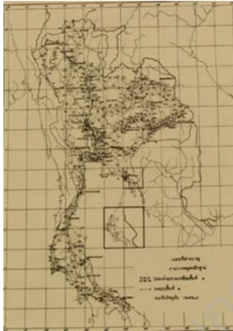
แผนที่ประเทศไทย จากหนังสือสารานุกรมไทยสำหรับเยาวชน เล่ม ๑๒

การสอนภาษาไทยเรื่องการเขียนรายงานจากการศึกษาค้นคว้า ครูสามารถนำภาพจากเรื่องต่าง ๆ ในหนังสือสารานุกรมไทยสำหรับเยาวชนฯ ไปให้นักเรียนดูเพื่อกระตุ้นความสนใจ เช่น