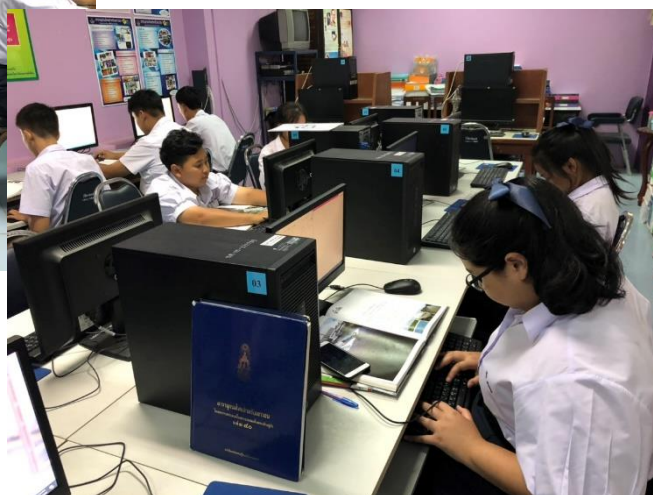
นักเรียนศึกษาค้นคว้าเนื้อหาจากหนังสือสารานุกรมไทยสำหรับเยาวชนฯ ด้วยคอมพิวเตอร์